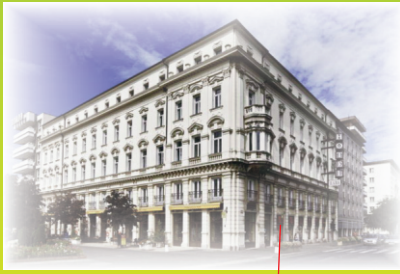
Rába Hotel Győr, Árpád u. 34.