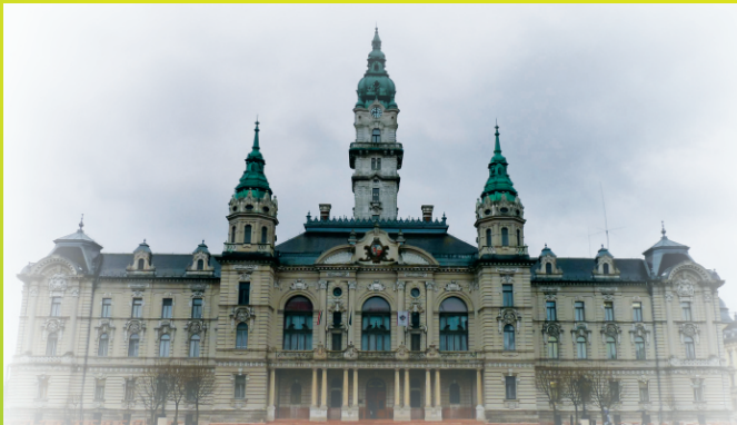
Városháza Győr, Városház tér 1.

EGÉSZSÉGES VÁROSOK MAGYARORSZÁGI SZÖVETSÉGE TAGVÁROSAI 2010-BEN